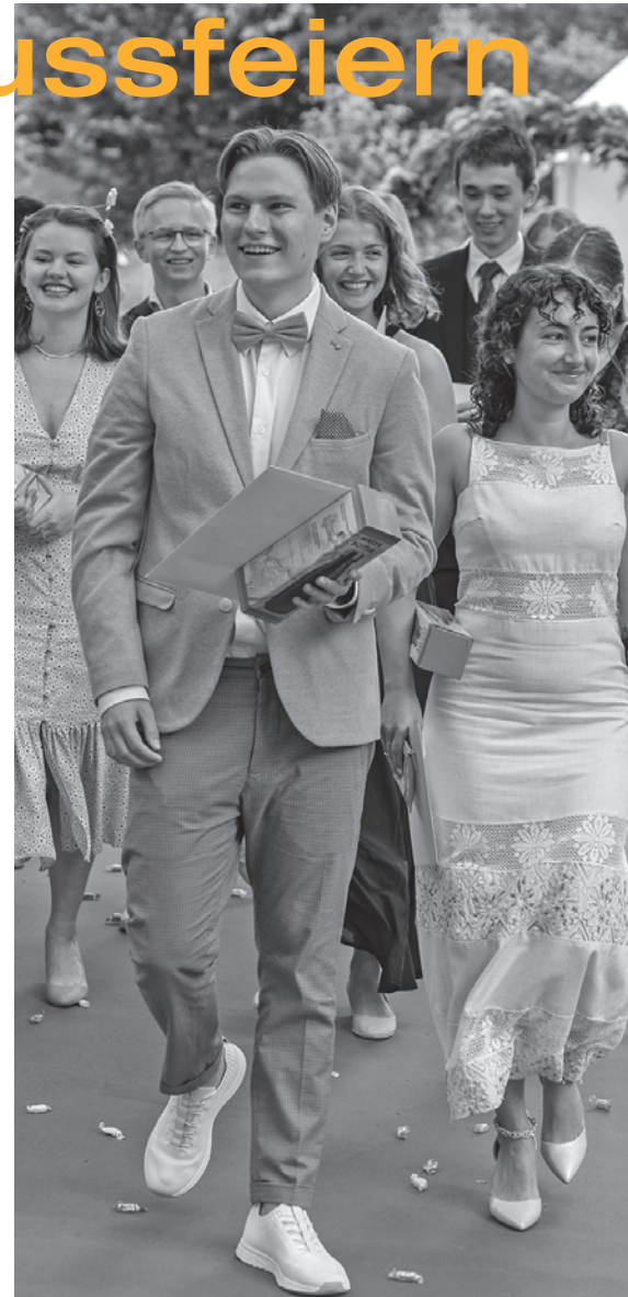
Stolz, den Abschluss trotz langer Fernunterrichtssequenzen geschafft zu haben: die FM4a und die G4A.