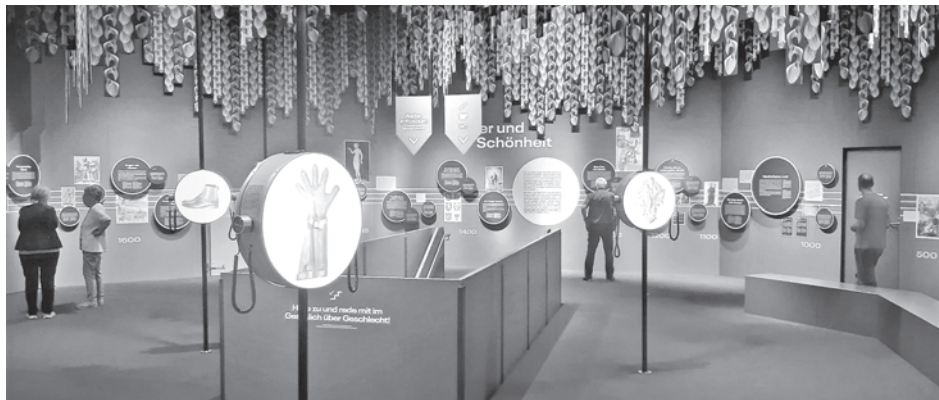
Ein historischer Überblick zum Thema Geschlecht im Hauptsaal des Stapferhauses.

Mann, Frau, Transmensch, inter, bigender, androgyn, neutral etc. – da kann man durchaus den Überblick verlieren. Das Stapferhaus klärt in der Ausstellung «Geschlecht» auf.