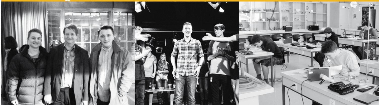
SchülerInnen der NKSA interessiert im «Literatuclub», engagiert am Kanti-Slam und motiviert an der Physikolympiade.