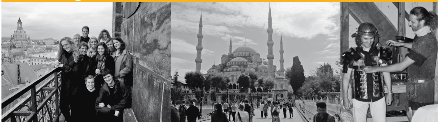
Die NKSA hoch über den Dächern von Dresden, vor der Sultan-Ahmed-Moschee in Istanbul, bei den Legionären in Vindonissa, am blauen Meer der Côte