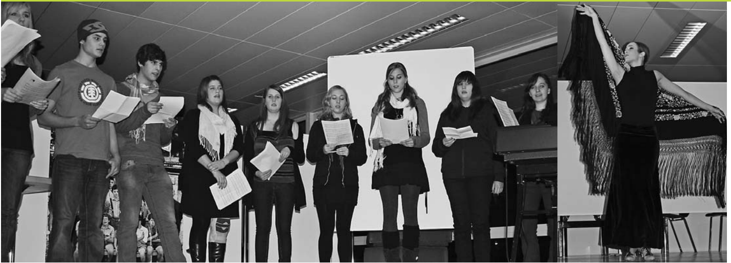
Serata: Von französischen Choristes zu spanischem Flamenco.