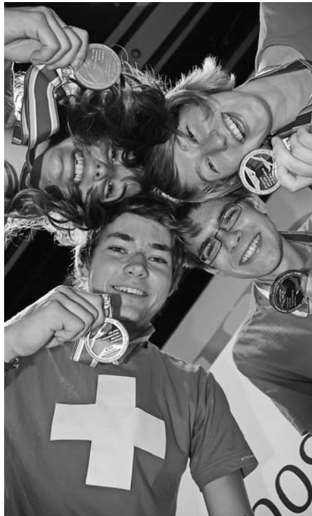
Erfolgreiche SchweizerInnen in Japan.

Kaum in Tsukuba (Japan) angekommen, wurden wir an einer pompösen Eröffnungszereemonie willkommen geheissen. Unter dem Motto «Dabei sein ist alles, denn eines habt ihr jetzt schon gewonnen: Freunde aus der ganzen Welt!» eröffnete Prinz Akishino die Olympiade. Dort fiel mir zum ersten Mal auf, von welcher internationaler Bedeutung dieser Wettbewerb sein sollte. Als wir unser Zimmer bezogen, schlossen wir bereits erste Freundschaften mit unseren schwedischen Mitbewohnern. Auch sonst freundeten wir uns mit vielen Teilnehmern an, so auch mit Tadschiken, Nigerianern, Vietnamesen und anderen exotischen Nationalitäten. Aber auch die Kultur Japans konnten wir bei