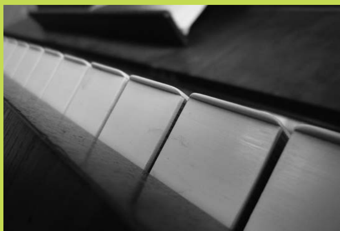
Die Bilder von Florian Tribelhorn, G1E zum Thema «Talent/Begabung» entstanden im Akzentfach infcom.ch bei Otto Grimm.