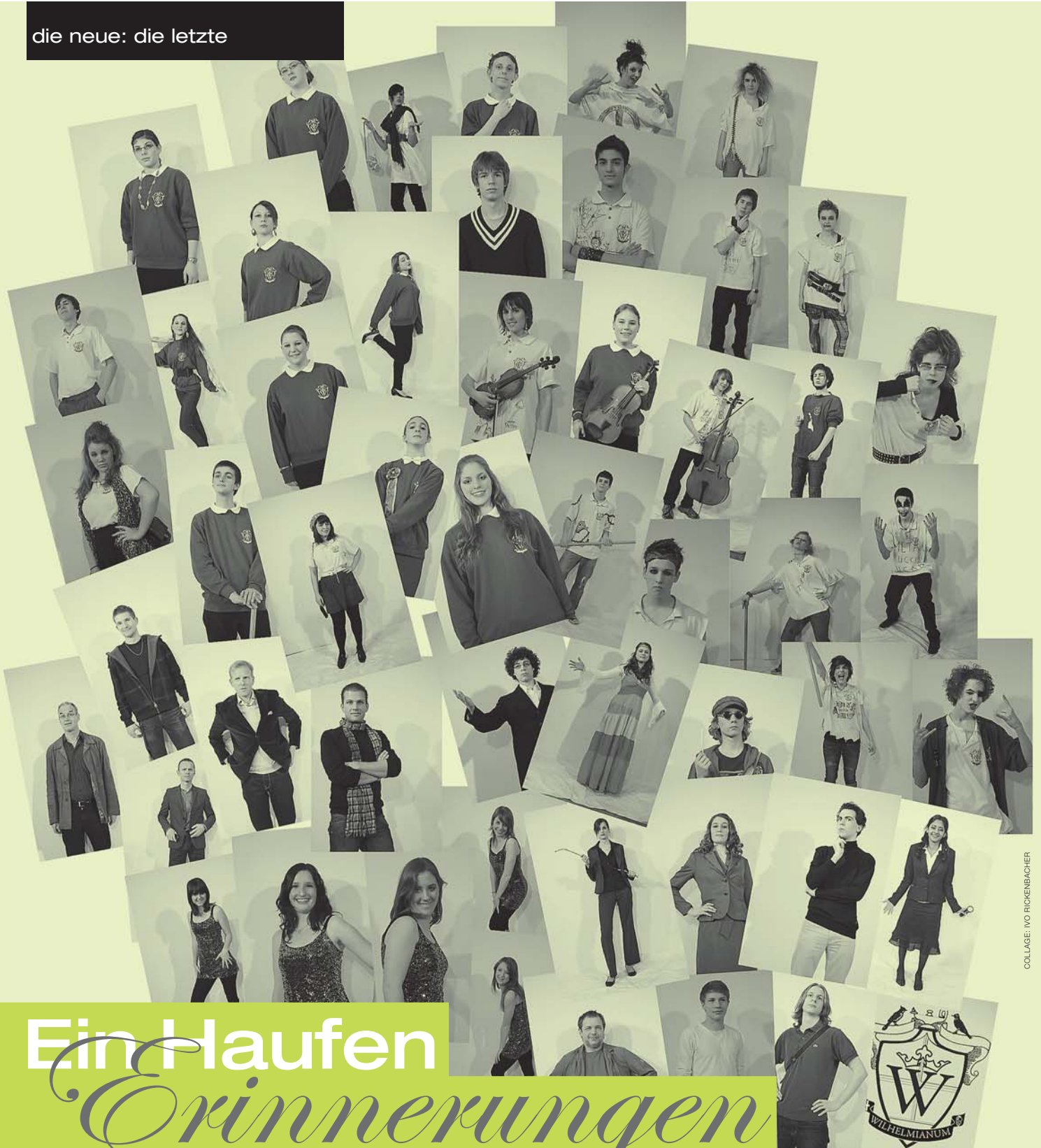
COLLAGE: IVO FICKENBACHER