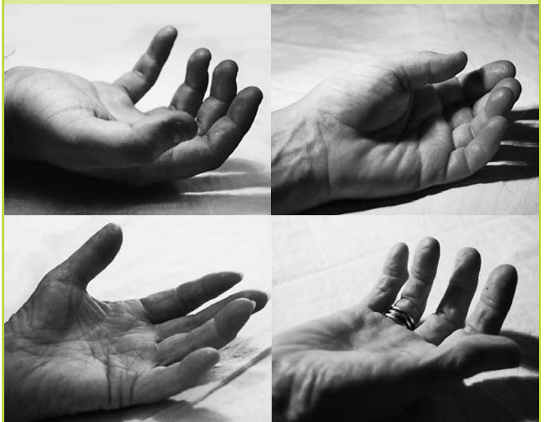
Die nach oben geöffneten Hände von Hinterbliebenen – sie symbolisieren die Offenheit, sich der Verarbeitung zu stellen.