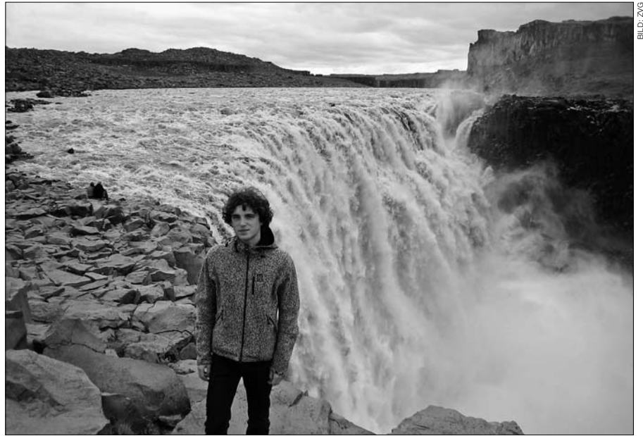
Dettifoss, wasserreichster Wasserfall Islands.

Züge gibt es in Island nicht. Entweder fahren die Leute mit dem Auto sechs Stunden lang nach Reykjavík oder sie fliegen. Fahrradfahren mögen sie nicht, ausserdem fällt man im Winter sowieso nur hin, da die Strassen nicht vom Schnee befreit werden, sondern im besten Fall nur Salz oder Kies gestreut wird. Die Jugendlichen machen mit 17 Jahren ihren Führerschein, und anstatt «rumzuhängen», fahren sie mit dem Auto ihrer Eltern um das Stadtzentrum. Rúnta nennt sich diese Beschäftigung, bei der man mit Freunden im Auto Musik hört und Ausschau nach Mitschülern oder der Neuen des Exfreundes hält. Sowohl Jungen