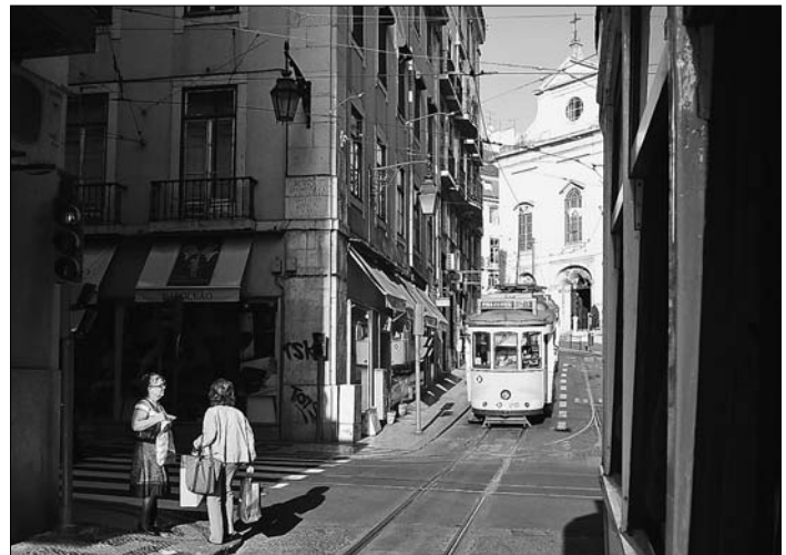
«Die weisse Stadt am Tejo»: Eine unvergessliche Woche!