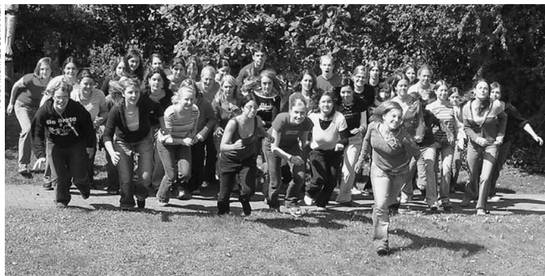
Der Chor startet durch.