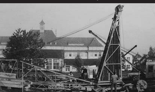
Eine Schule mausert sich zur unabhängigen Institution – den Lehrkörper freut's!