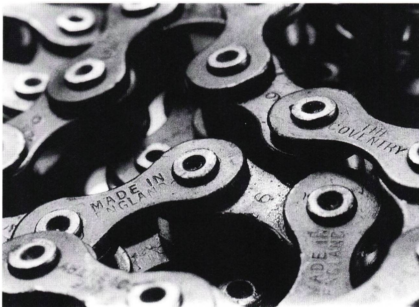
Fahrradkette Pentax 50mm mit Zwischenringen: B 11 / 1/125 (Anja Büschlen)