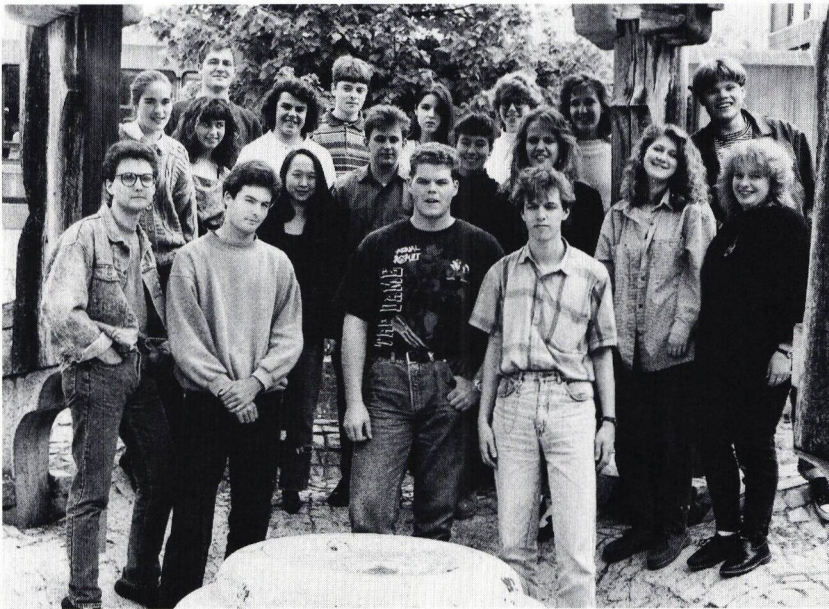
Klasse 4 B