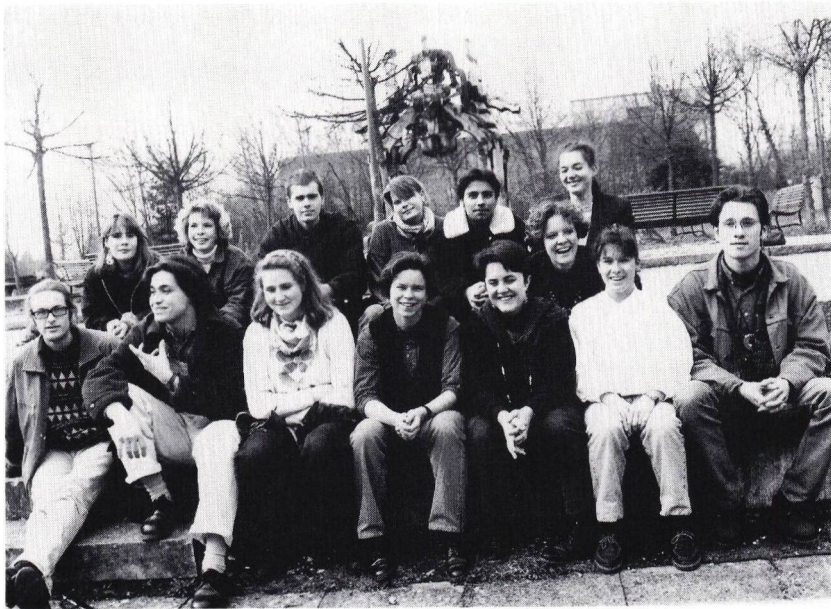
Klasse 4 D