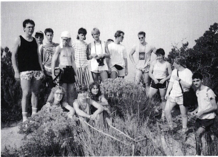
Klasse 4 C