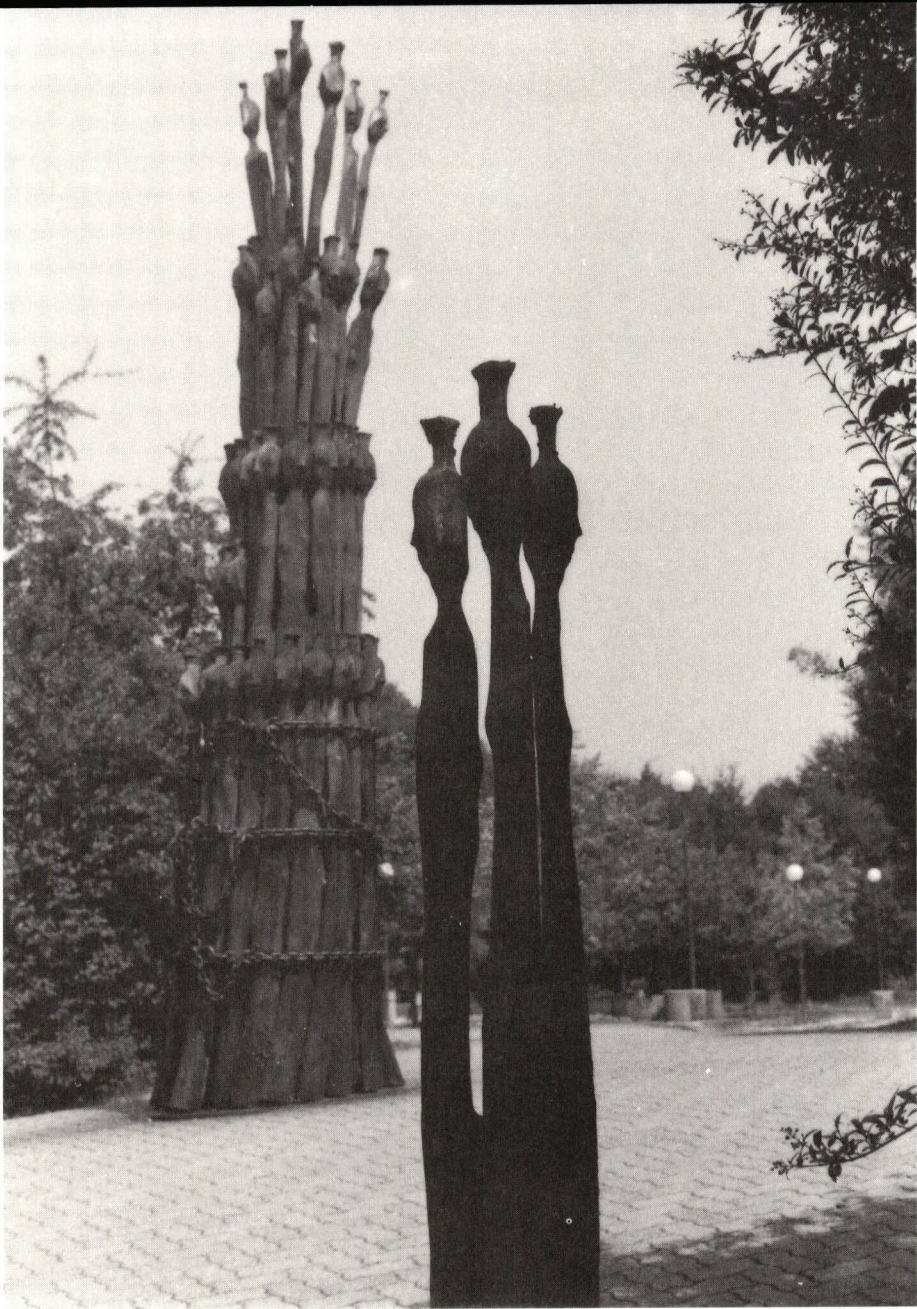
Aargauische Kantonsschule Zofingen 17. Jahresbericht 1989/90