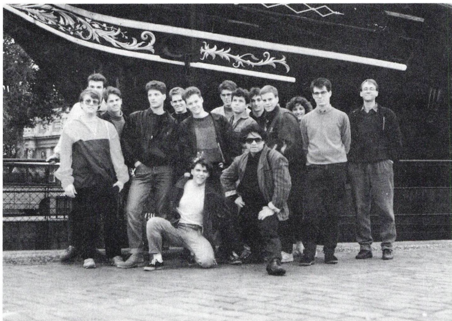
Klasse 4 C