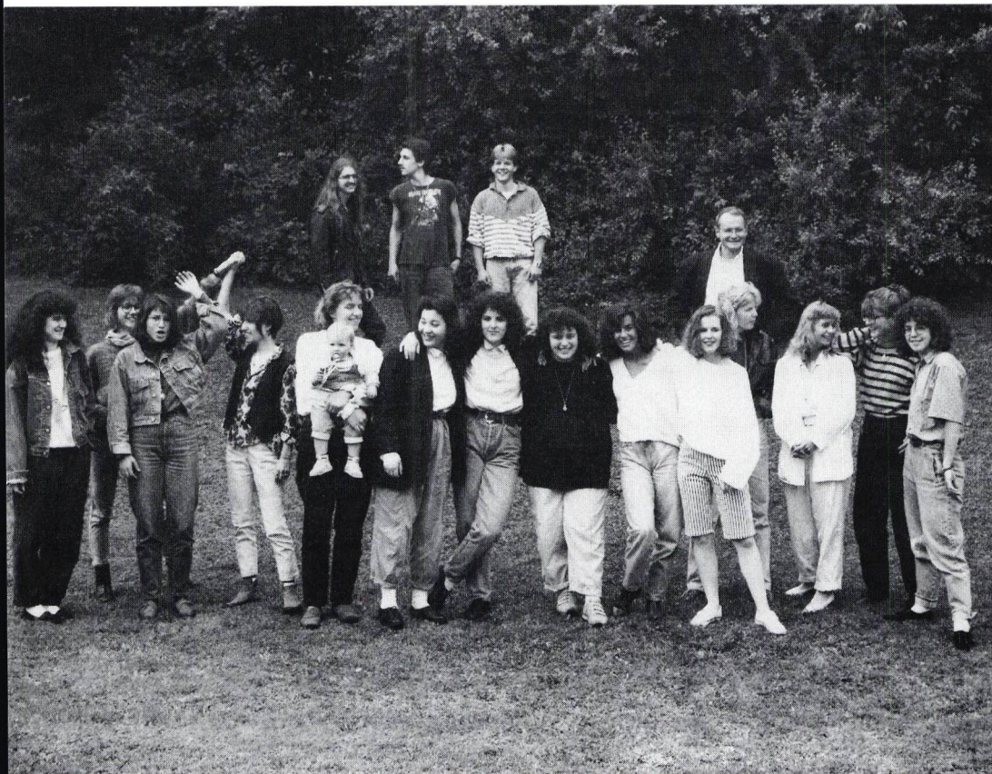
Klasse 4 D