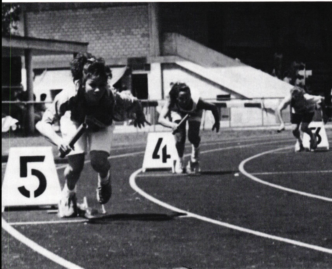
4 x 100 m-Staffel Mädchen (Leichtathletiknachmittag 1990)