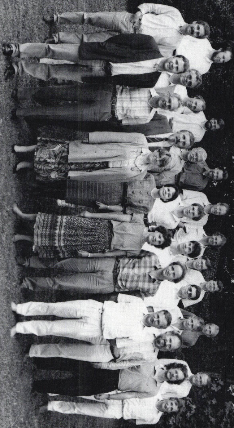
Lehrerschaft der KSZ (Juli 1990)