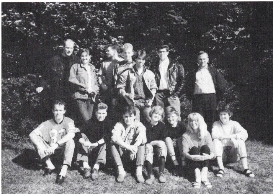
Klasse 4 A/B