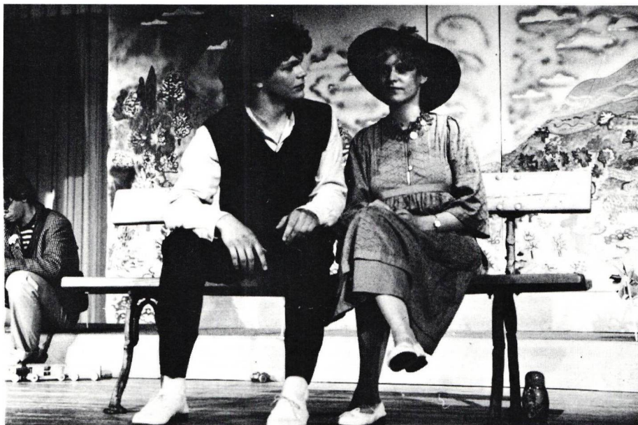
"Le piéton de l'air" de Ionesco, Klasse 3D