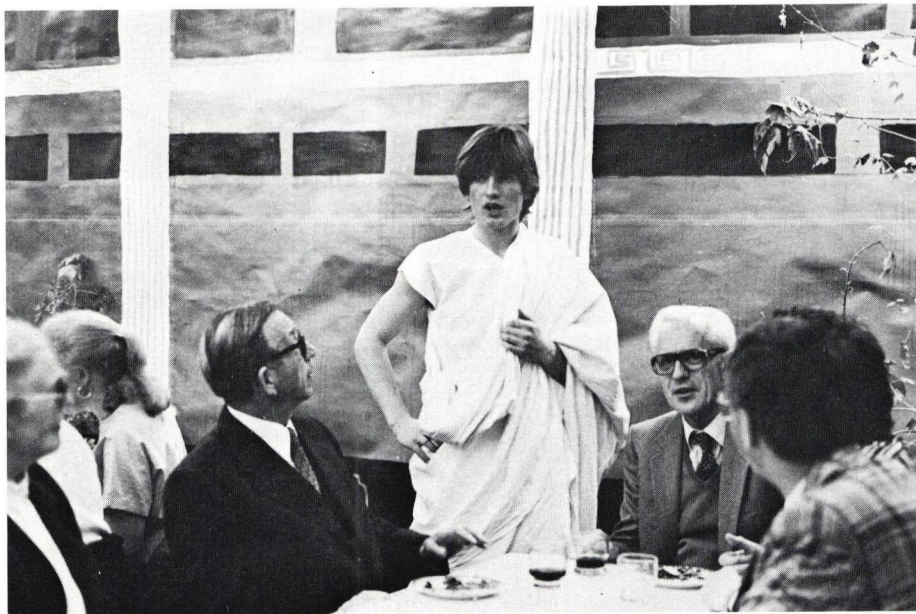
In der "Taberna Romana", Klasse 2B; ein Römer mit seinen Lateinlehrern