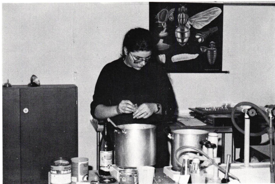
Vorbereitung Klasse 3B, "Grotto Ticinese"