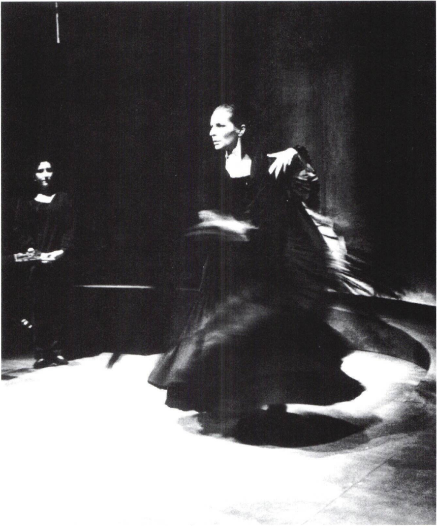
Kanti-Forum: "Gritos". Eine Produktion der Gruppe Flamencos en Route.