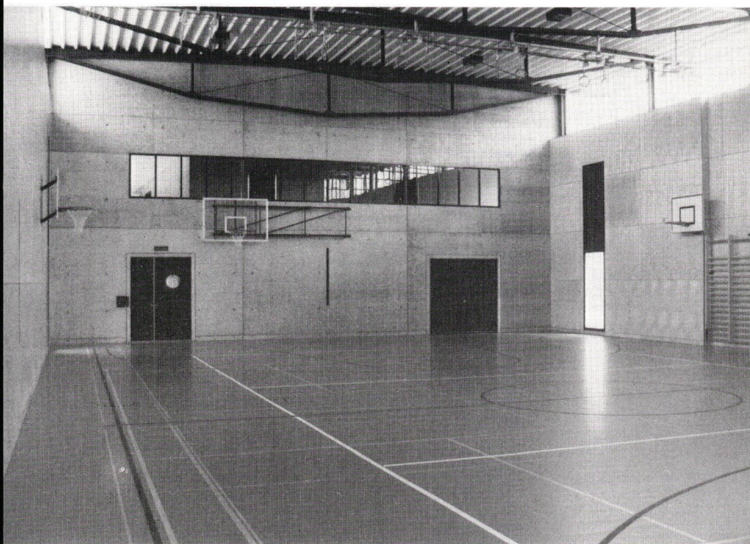
Innenansicht der neuen Turnhalle