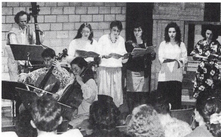
Ein Teil der Interpreten von Mozarts «Bastien und Bastienne», einer Aufführung der HPL Zofingen.

Die HPL Zofingen singt und spielt in der Aula des BZZ