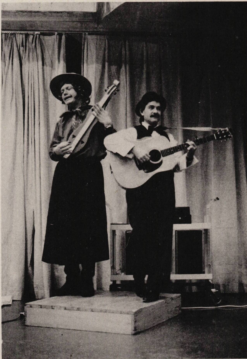
Kanti-Revue 1983: Heimat...