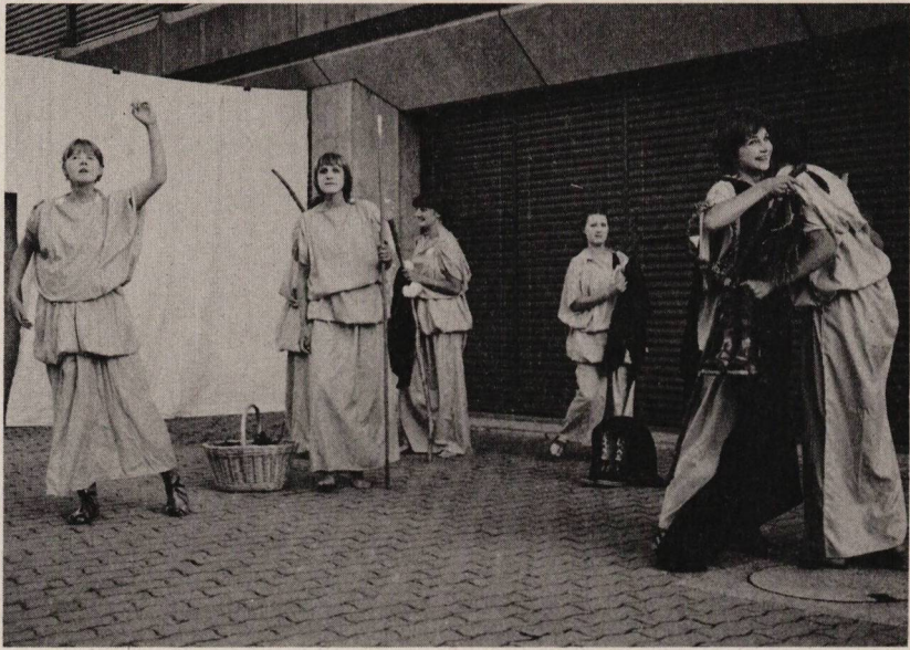
Die Frauen an der Volksversammlung