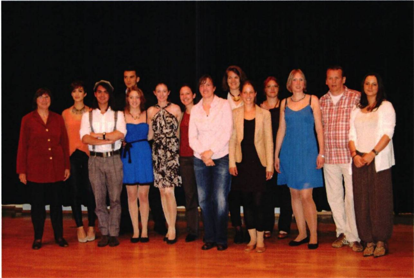
Maturaklasse 6a, Kurs 20