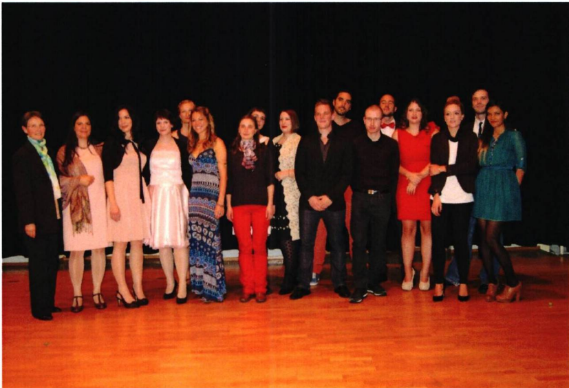
Maturaklasse 6c, Kurs 20