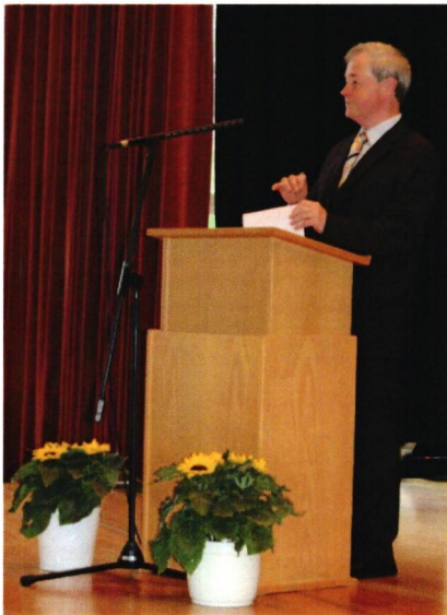
Ansprache an der Maturfeier 2013 der Aargauischen Maturitätsschule für Erwachsene (AME) in der Klosterkirche Muri, 29. Juni 2013

Nun wünsche ich Ihnen einen frohen, einen festlichen Abend. - Ich danke Ihnen.