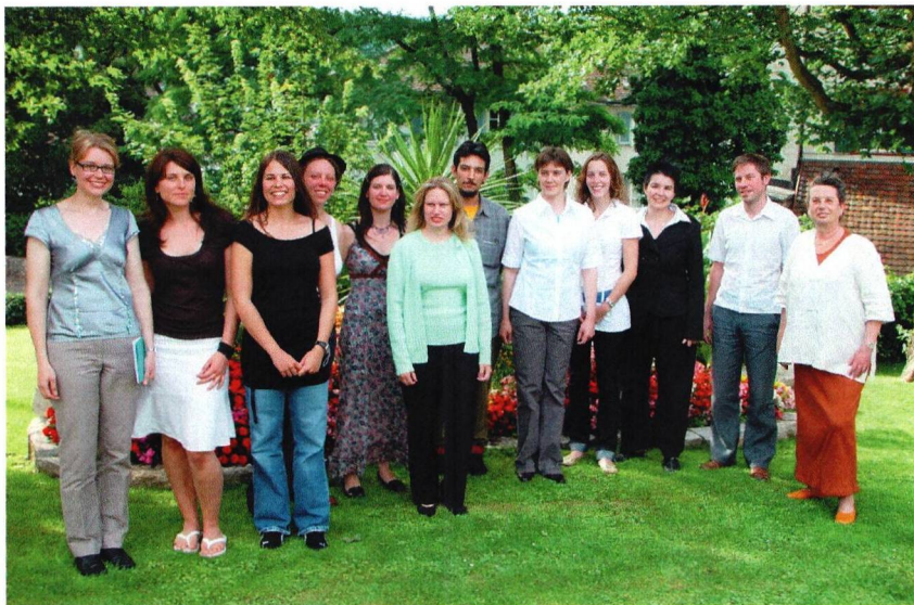
Maturaklasse 6a, Kurs 14