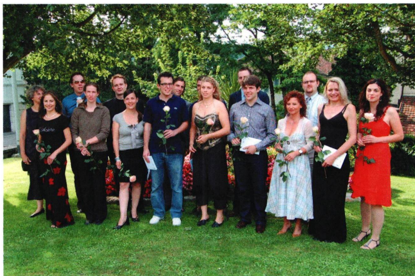
Maturaklasse 6b, Kurs 14