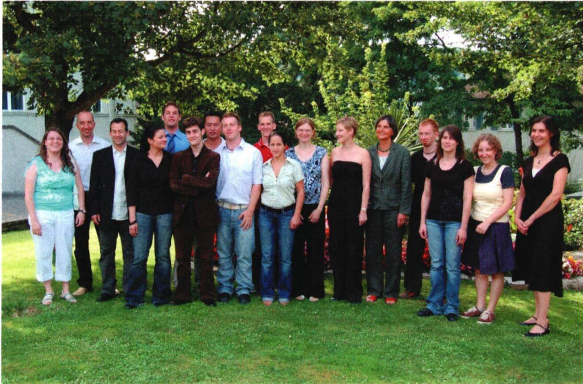
Maturaklasse 6c, Kurs 14