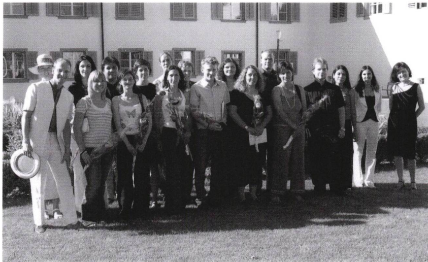
Maturaklasse 6a, Kurs 13