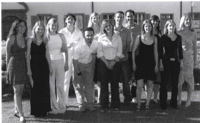
Maturaklasse 6c, Kurs 13