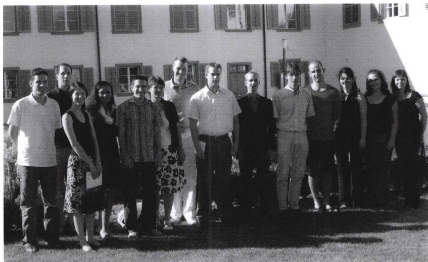
Maturaklasse 6b, Kurs 13