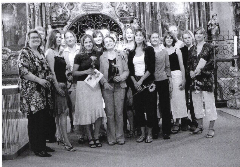
Maturaklasse 6a, Kurs 12