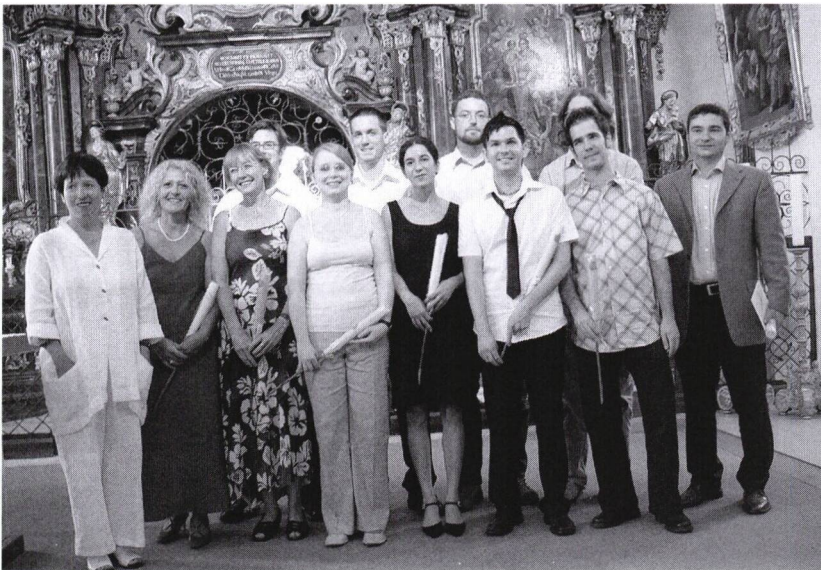
Maturaklasse 6c, Kurs 12