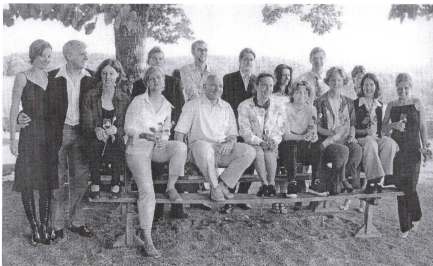
Maturaklasse 6a, Kurs 9