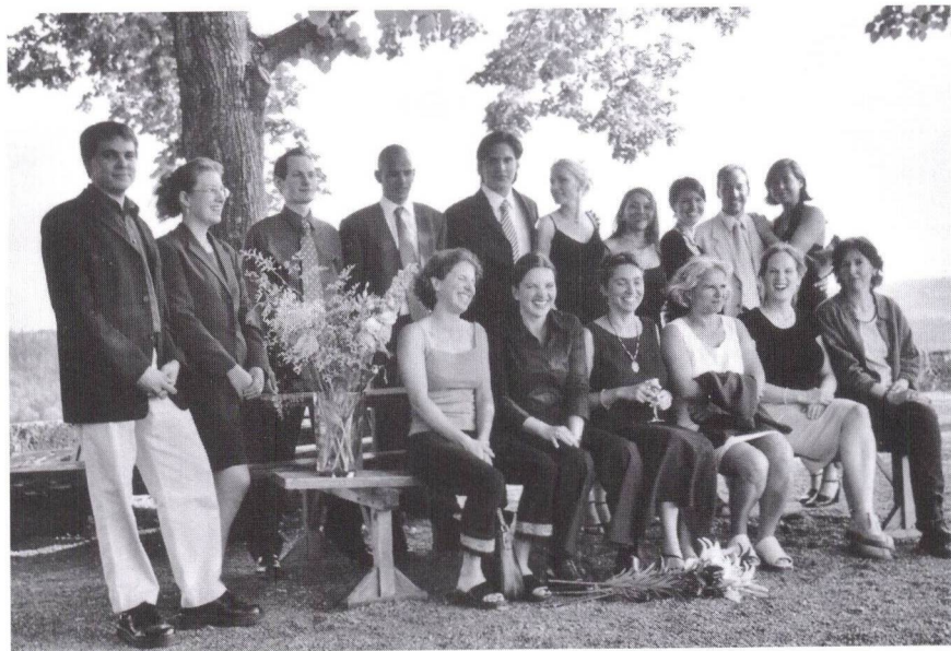
Maturaklasse 6c, Kurs 9