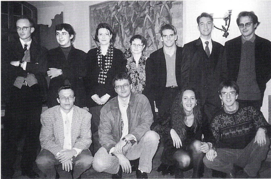
Maturklasse 7b, Kurs 2