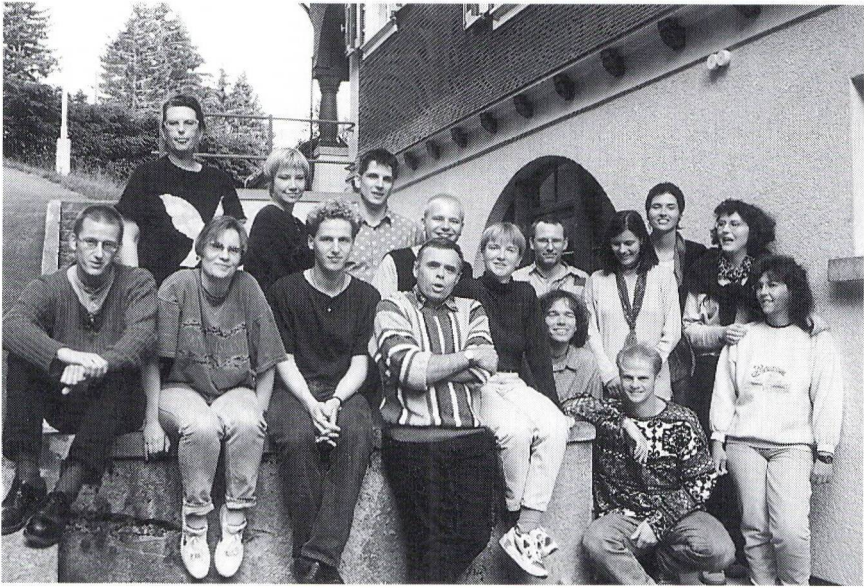
Maturklasse 7c, Kurs 3