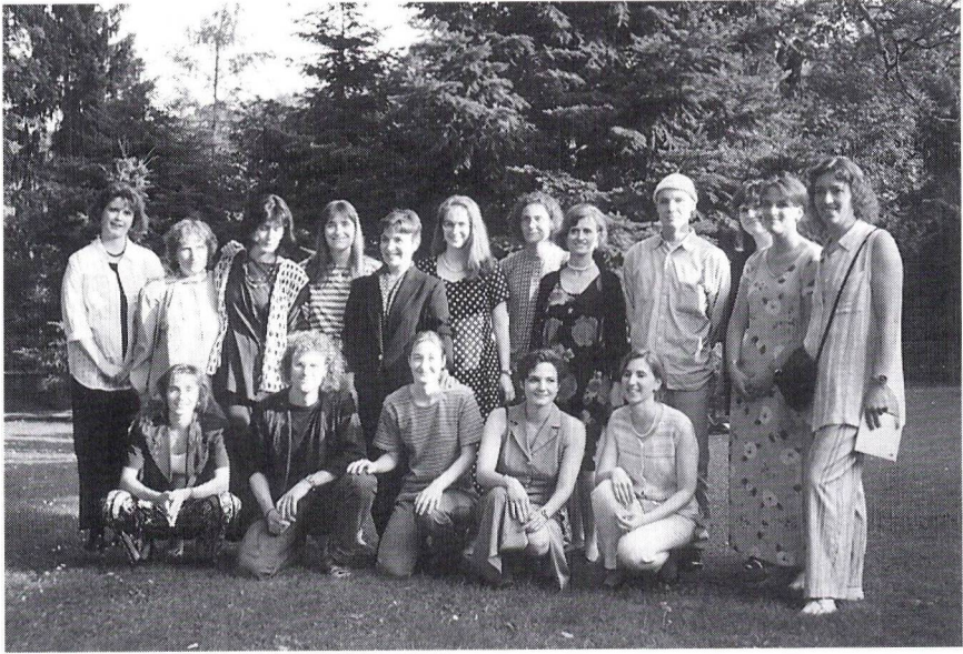
Maturklasse 7a, Kurs 3