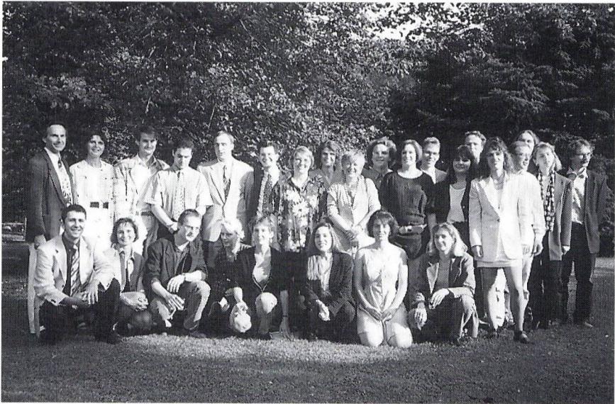
Maturklasse 7d, Kurs 3