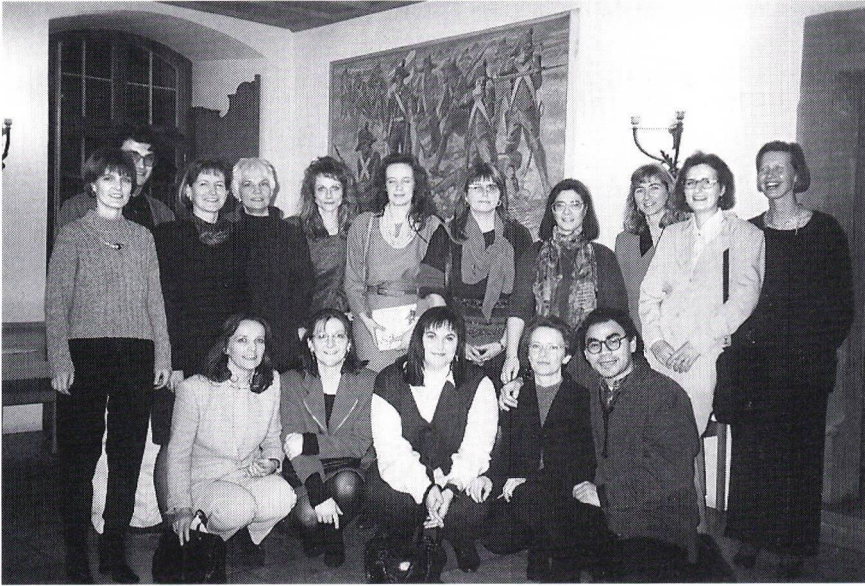
Maturklasse 7a, Kurs 2