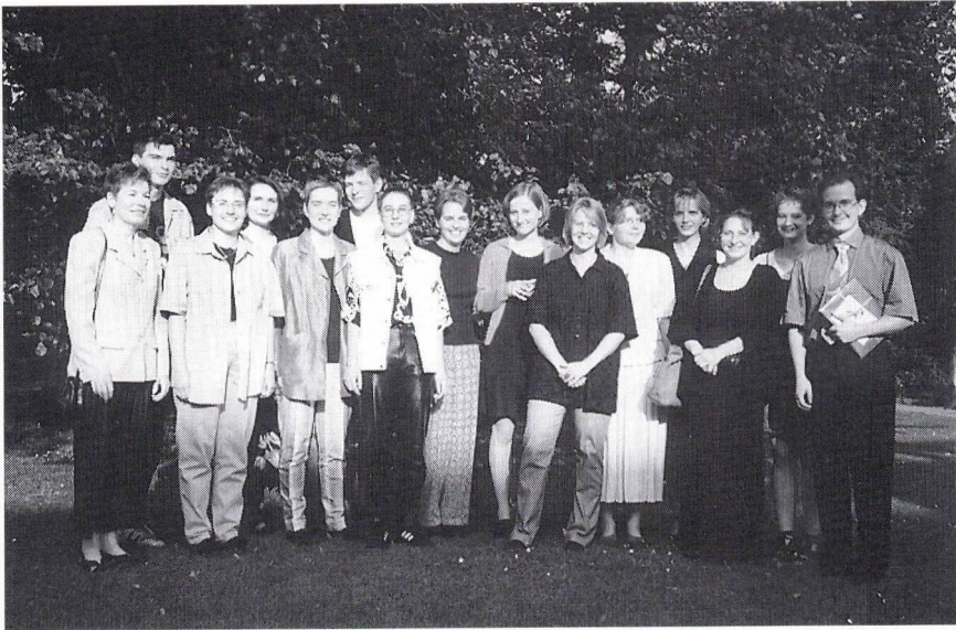
Maturklasse 7b, Kurs 3