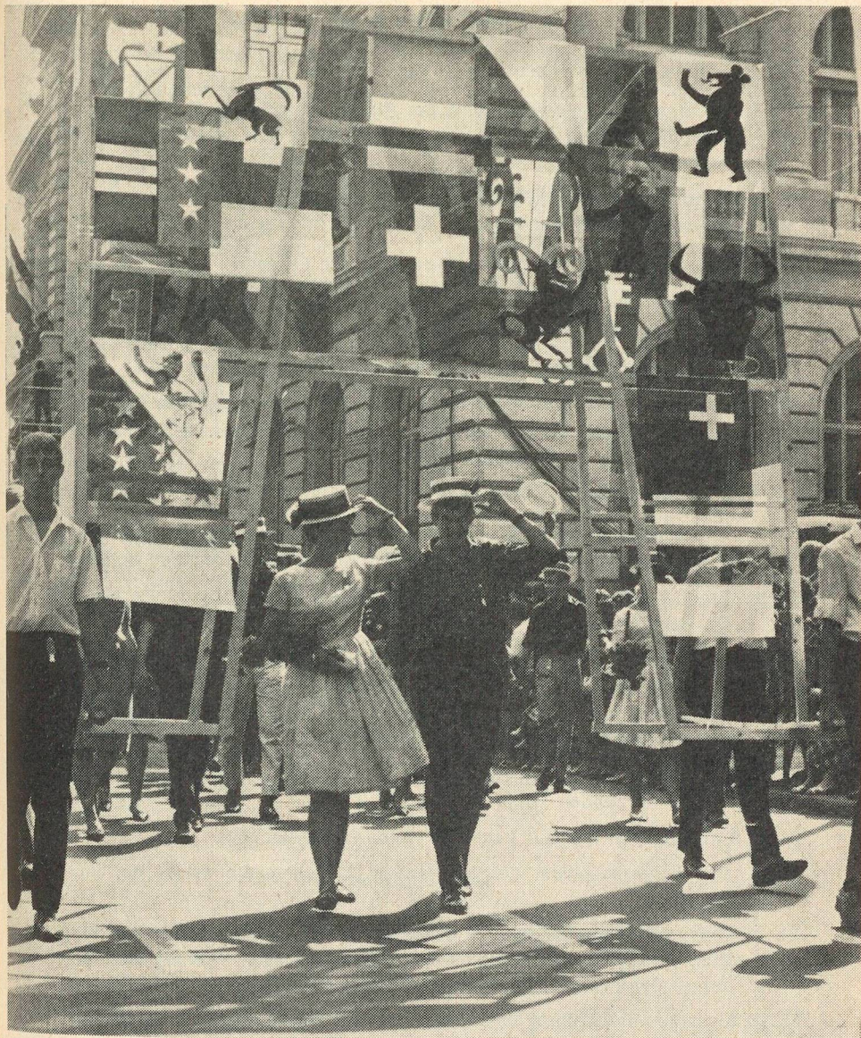
Solidarität: Waadtländerin und Aargauer unter dem «Expotor» (Motiv aus dem Festzug)