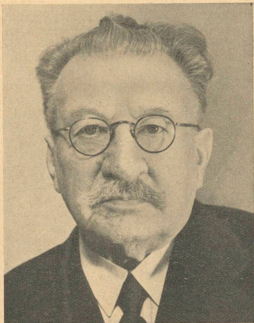
I V O P F Y F F E R

Seminarlehrer 1898—1938 Seminardirektor 1916—1923