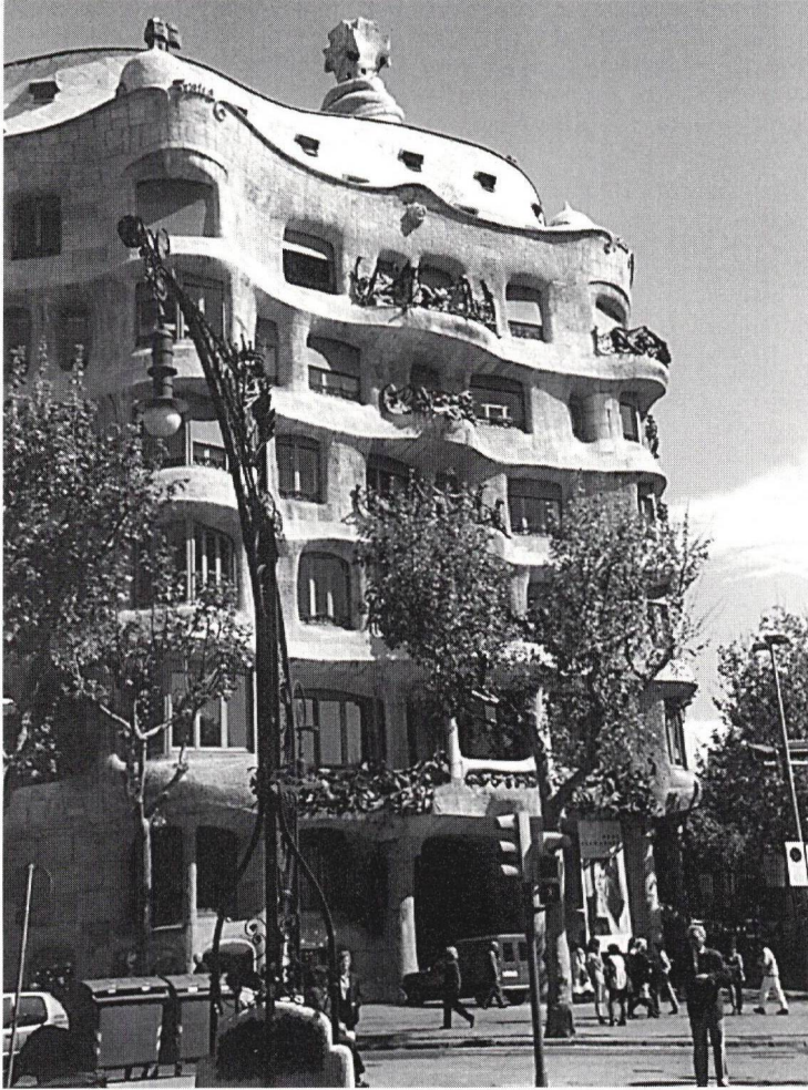
Casa Milà: in Barcelonas Promenierstrasse Paeso de Gracia

Brotlaib. Auf dem Dach erheben sich Schornsteine des Gebäudes, verdrehte Türme mit Skulpturen, die Kriegern ähneln. Gegen Mittag besichtigten wir dann noch die Sagrada Familia, die bis jetzt noch nicht fertiggestellt ist. Gaudí wollte eine Kirche schaffen, die zwanzig Türme haben sollte, vier auf jeder Seite zu Ehren der Apostel. Einige getrauten sich auf die Türme, von denen man über die ganze Stadt hinweg sah.