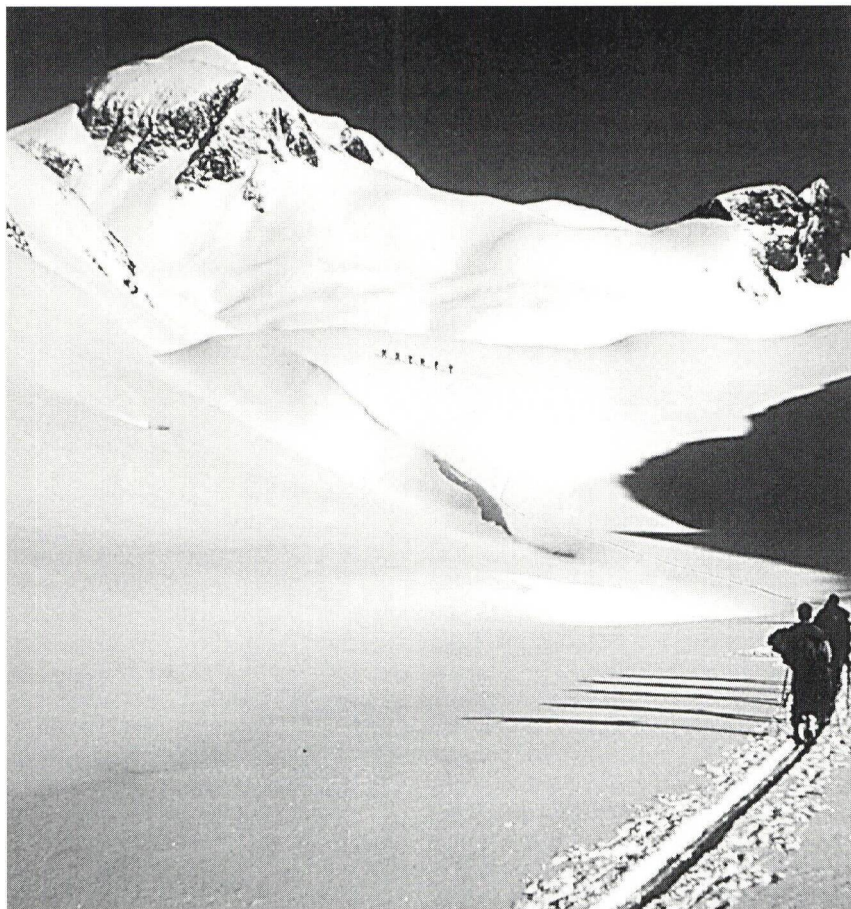
Aufstieg zum Grieshorn

im Rettungsschlittenbau und in weiteren interessanten Dingen. Dabei schneit es allerdings ununterbrochen. Wem ein wolkenverhangener Himmel, starker Schneefall und ein Meter Neuschnee gefallen, für den mag das Wetter am nächsten Morgen schön sein. Um 8 Uhr, nach einem ausführlichen Morgenessen, geht's los. Wir verlassen die Maria-Luisa-Hütte Richtung Schweiz. Via den Passo di San Giacomo erreichen wir All'Acqua im Bedrettotal und fahren von dort aus einen Tag früher als vorgesehen nach Hause zurück.