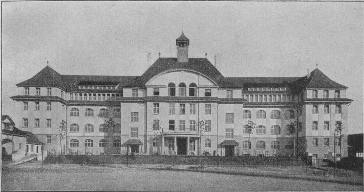
Das neue Zelgischulhaus (Nordfassade).